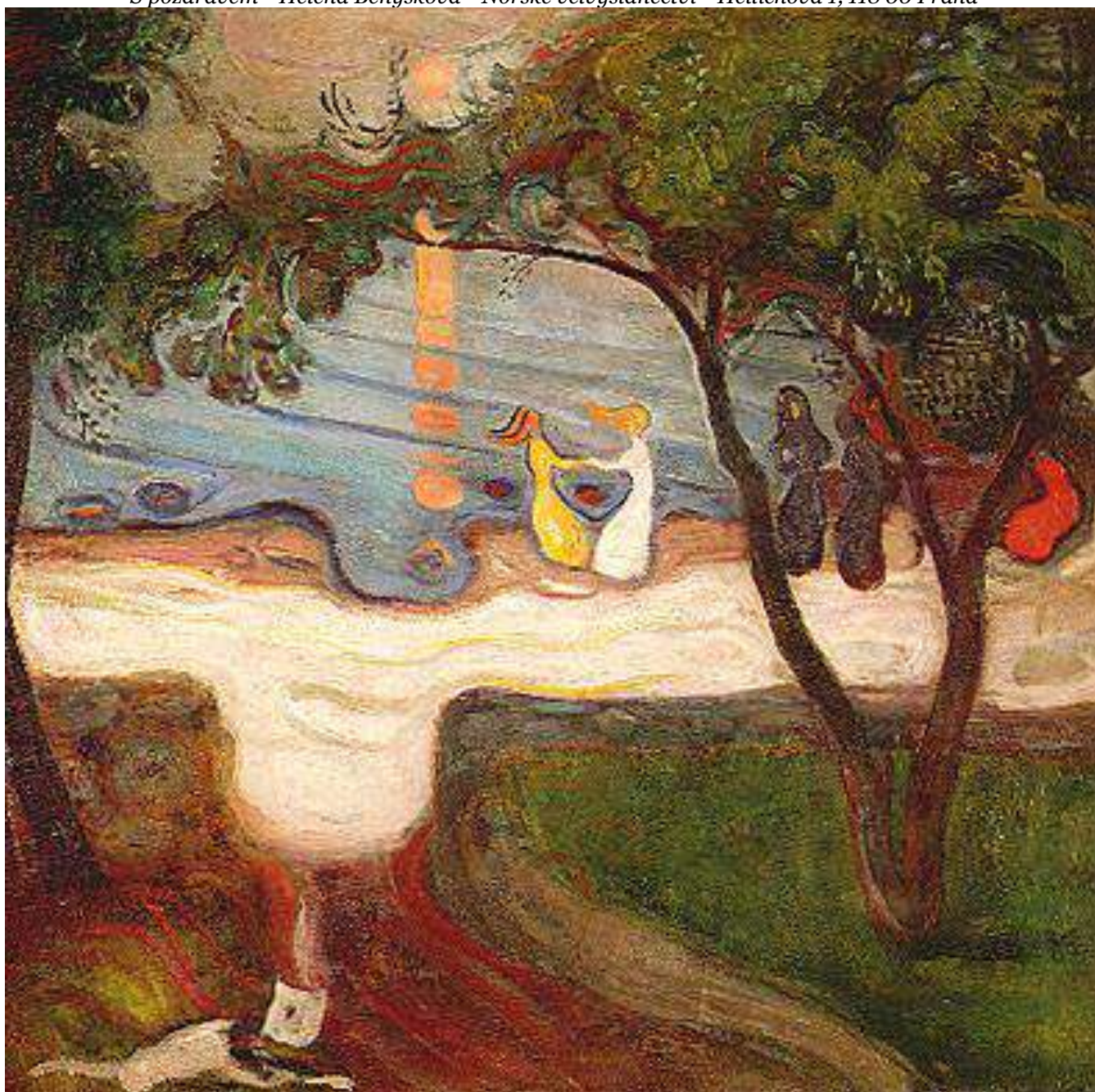
Edvard Munch: Tanec na břehu; www.edvard-munch.com